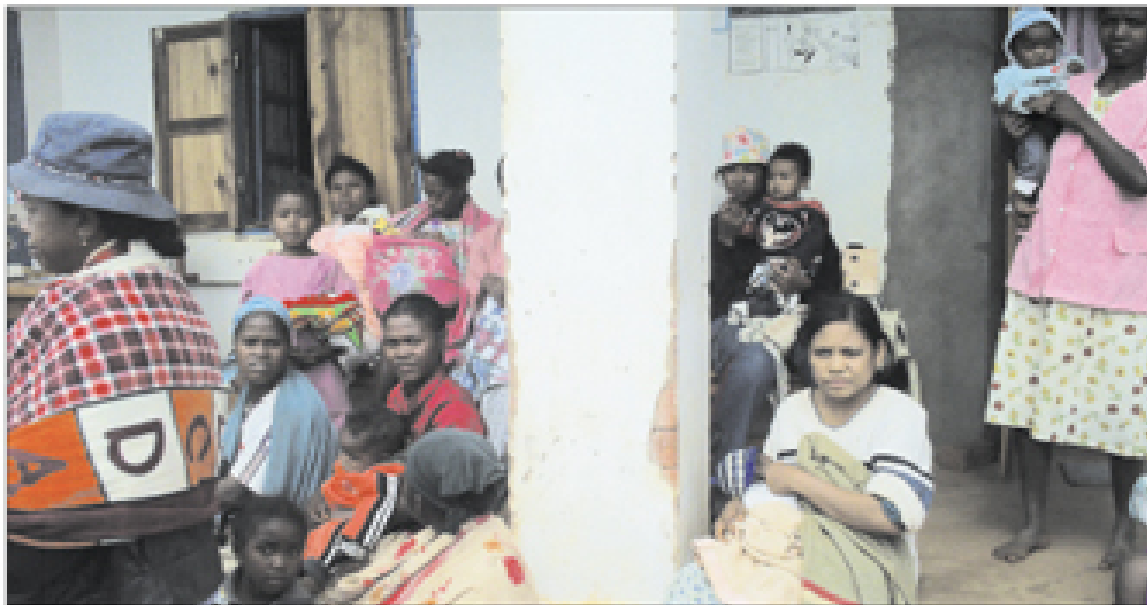
Les enfants et les bébés sont les principales victimes de la poussée de la grippe.

Les cas de grippe augmentent ces derniers temps, le froid aidant. Certains centres de santé sont débordés. Des malades craignent la grippe porcine.