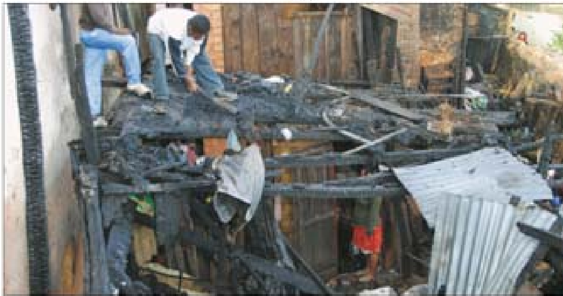
Le feu a débité dans cette maison en bois avant d'atteindre deux constructions en dur.

Grave incendie, hier, dans le quartier d'Anjanahary, où trois maisons ont pris feu. Deux femmes ont dû être évacuées à l'hôpital. PAGE 10