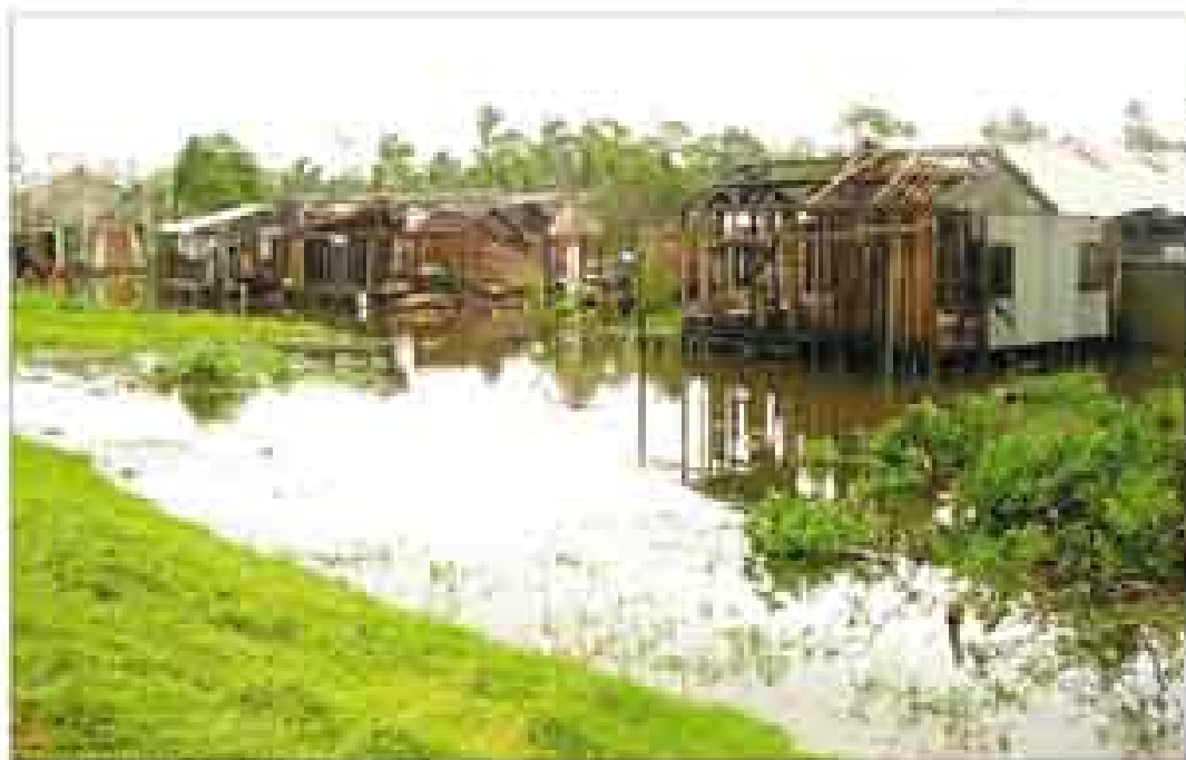
Les zones n'ont pas cessé à la suite d'inondations.

La ville de Maroantsetra a été durement frappée par le cyclone Indala. Elle est détruite à 50% selon un bilan officiel. Complètement inondée, Maroantsetra est en plus isolée du monde, n'ayant aucun moyen de communication. Les opérations de secours des sinistrés sont ainsi difficiles.