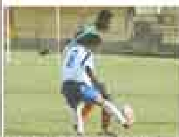
Militaire à la suite de l'attaque de l'AS Adema par les Barea à Antananarive.