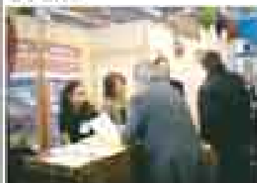
Le stand de Madagascar au Salon mondial du Tourisme.