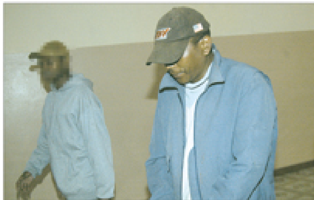
Un membre du comité de vigilance civile (à gauche) en 2002 prisonnier au pénitencier, en l'occurrence condamné à trois ans d'emprisonnement.

Les procès sur les événements de 2002 continuent. Un membre du comité de vigilance civile d'Atsimo de l'époque est condamné à trois ans d'emprisonnement ferme pour avoir tabassé mortellement un passant. Il a bénéficié d'une circonstance atténuante, le victime l'agent provocateur en brisant le barrage érigé par le comité. » 9